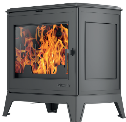
Печь-камин EVEREST Н16

Печь-камин EVEREST Н16/Н16Р изготовлена из качественного жаростойкого чугуна с толщиной стенок 6-8 мм. Модель рассчитана на обогрев помещений объемом до 320м 3 . Печь-камин имеет пламегаситель из жаростойкого чугуна (ГОСТ 1412-85). Топка печи-камина оснащена системой трёхуровневого вторичного дожига. С помощью этой функции по каналам подачи вторичного воздуха поступает воздух, который нагревается при прохождении между топочной камерой и стенками корпуса. Далее нагретый воздух через дефлектор поступает в топку, перемешивается с газами - продуктами горения, чем вызывает повторное возгорание. Подача воздуха в колосниковую зону, осуществляется рычагом, расположенным в нижней части печи-камина. В верхней части над топочной дверью расположена ручка регулировки системы чистое стекло, которая препятствует оседанию сажи на внутреннюю поверхность стекла. Патрубок дымохода Ø 150 мм – универсальный, со сменным положением. Он может быть установлен сверху или сзади в зависимости от размещения печи в помещении.