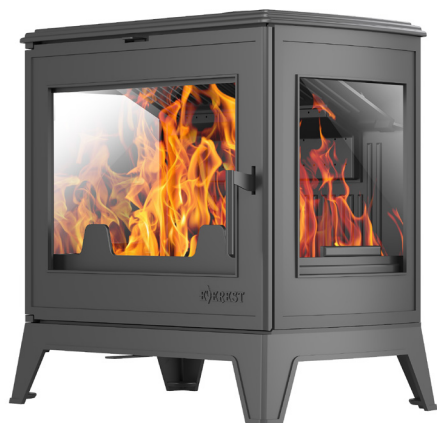
Печь-камин EVEREST Н16Р